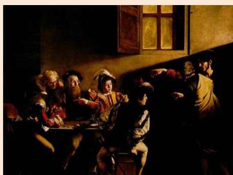
Caravaggio, “Vocazione di san Matteo” chiesa di san Luigi dei francesi - Roma 1599-1600

Caravaggio, “Conversione di San Paolo” Santa Maria del Popolo - Roma 1600-1601